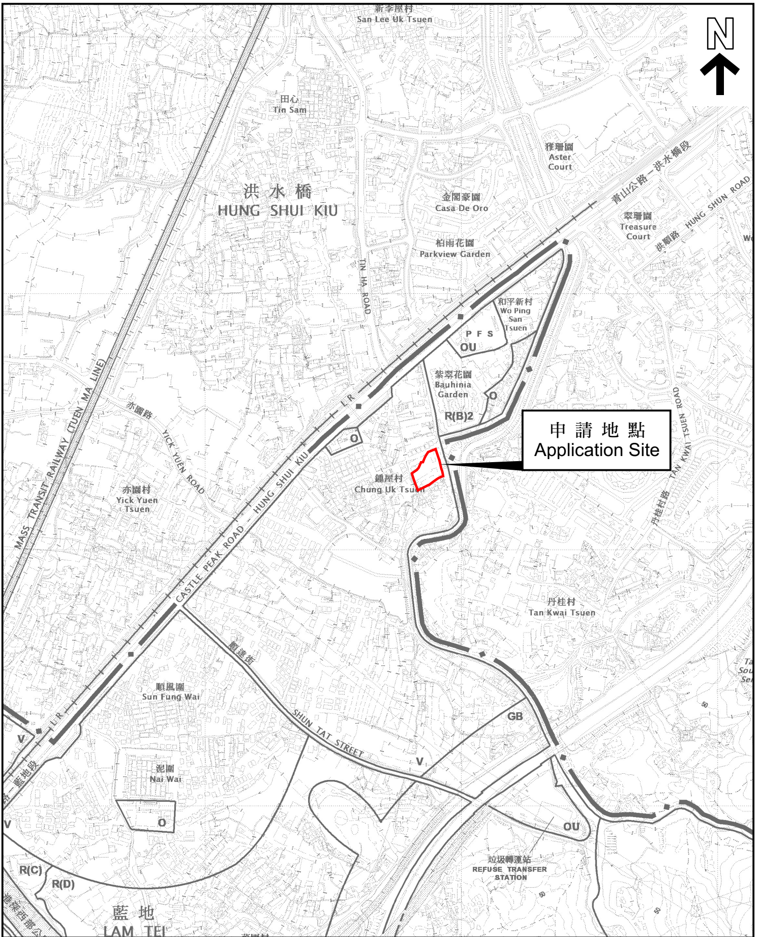
位置圖 LOCATION PLAN

本摘要圖於2023年3月23日擬備， 所根據的資料為於2022年11月8日 核准的分區計劃大綱圖編號 S/TM-LTY/12 EXTRACT PLAN PREPARED ON 23.3.2023 BASED ON OUTLINE ZONING PLAN No. S/TM-LTY/12 APPROVED ON 8.11.2022