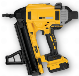
電動直接緊固釘槍