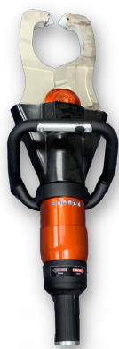
手提油壓夾混凝土機