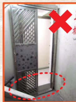
鋪設實心地台以致過度加厚樓板