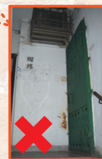
樓梯的圍牆開鑿洞口