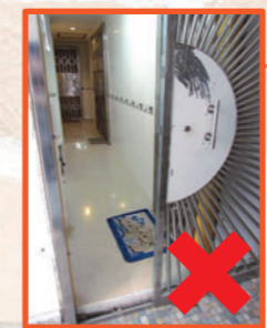
樓宇單位原有入口的防火門被拆除或以不符合所需耐火效能的門代替該門