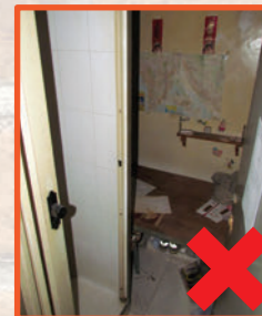
分間單位內沒有設置窗戶