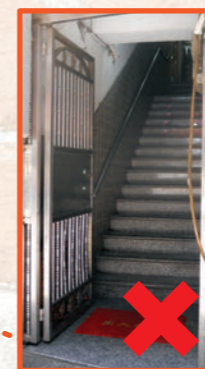
鐵閘阻礙逃生途徑