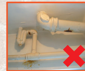
排水渠系統有漏水徵狀