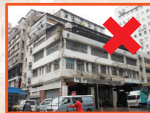
工業樓宇內的分間樓宇單位不應作住用用途