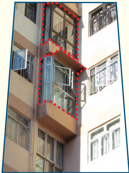
原有批准花槽上加建圍封窗戶