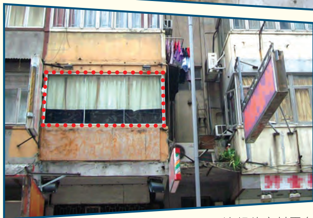
地下天井的僭建物