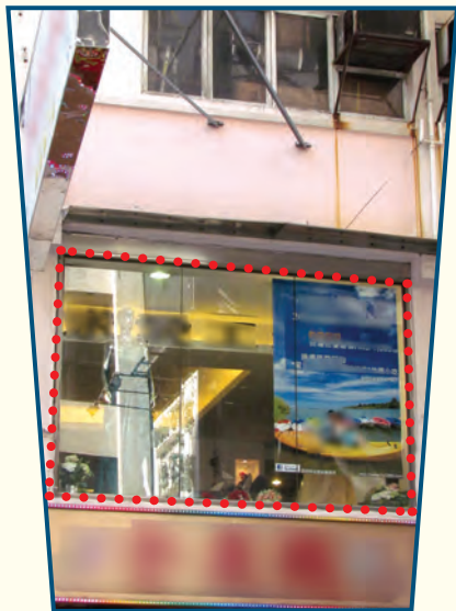
違規的大型玻璃嵌板