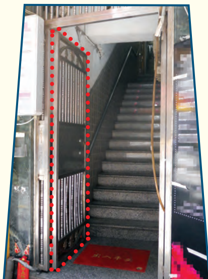
阻礙走火通道的鐵閘