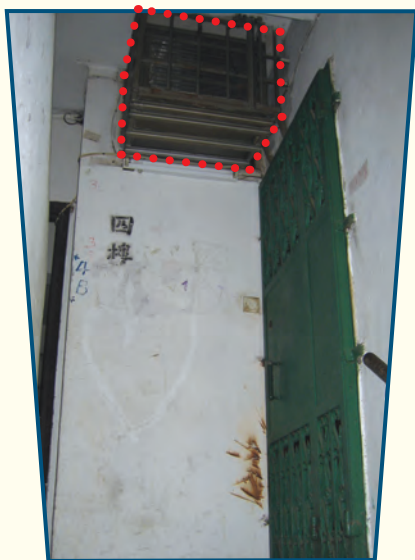
樓梯的圍牆開鑿洞口