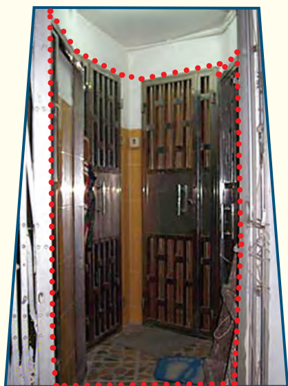
違規的分間單位工程