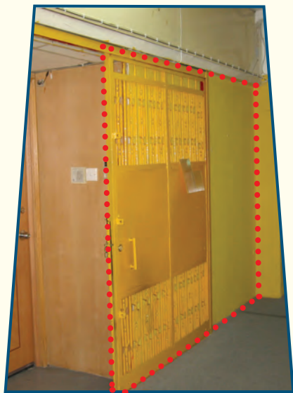
個別單位入口而無阻礙走火通道的 金屬鐵閘