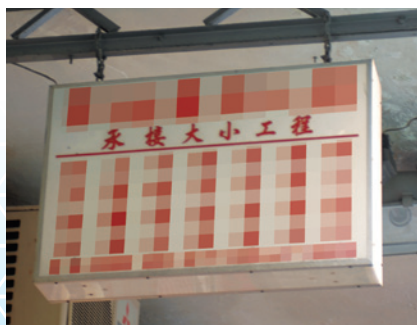
位於或懸掛於不是懸臂式平板的露台或簷篷上/底部之下的招牌