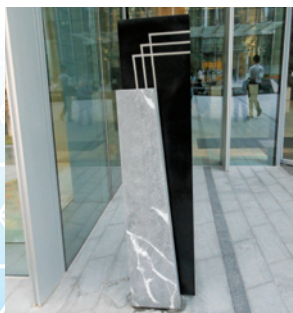
豎設於地面的戶外招牌