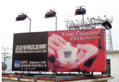
於建築物屋頂的招牌